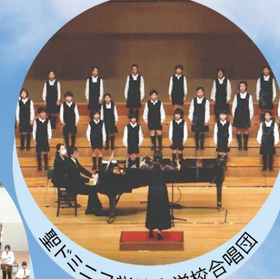
聖ドミニコ学院小学校合唱団