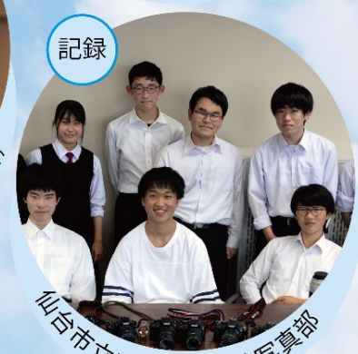
仙台市立工業高等学校写真部