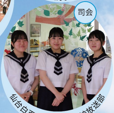
司会 仙台白百合学園高等学校放送部