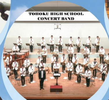
東北高等学校音楽部