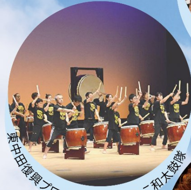
海中田復興プロジェクト かっこ和太鼓隊